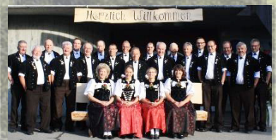
JK Frohsinn Heistrich