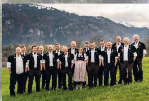
JK Bärgecho Brienz